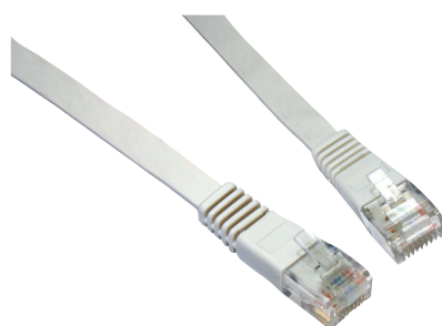
Ploché patch kabely