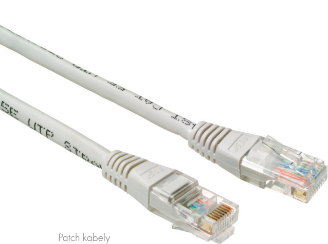
Patch kabely s non-snag-proof ochranou