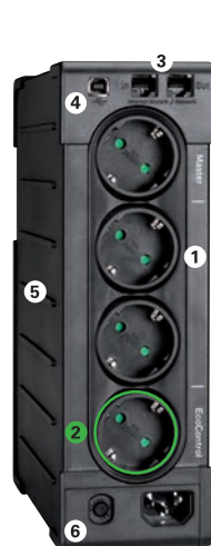
Eaton Ellipse PRO 650