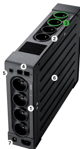
Eaton Ellipse PRO 1600