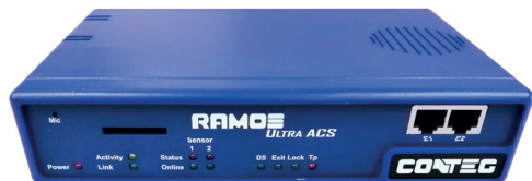
RAMOS Ultra ACS

Inteligentní monitorovací systém RAMOS slouží ke kontrole stavu vnitřního a vnějšího prostředí, jako například teploty, vlhkosti, úniku vody, kouře, ve velkých datových centrech, serverovnách nebo jednotlivých rozvaděčích. RAMOS lze navíc použít pro řízení přístupu.